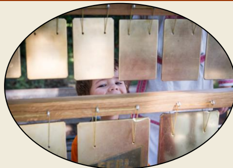
Выставочный зал «Колокола Руси» http://kolokola-rusi.ru